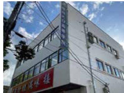
駐車場完備 9時～20時受付

初回お試しキャンペーン 2023年8月31日まで この「あんちゃん通信」と「保険証」を持参ください 保険+自費治療（問診含めて約30分） 通常 2,200 円のところワンコイン 500 円 で施術が受けられます