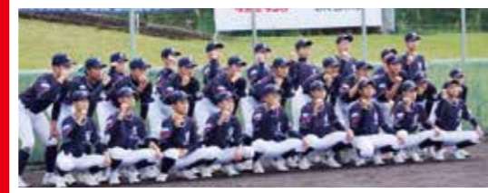
▲諏訪シーレックス

整骨院のオープンに伴い、諏訪市にあるリトルシニア野球チーム「諏訪シーレックス」と提携しました。中学生の選手の皆さんのメディカル面でのサポート、技術向上、身体作りに必要な勉強会などを通して、トレーナーとしての活動も行っております。